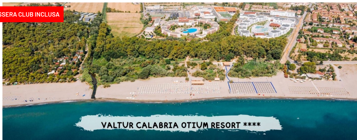
VALTUR CALABRIA OTIUM RESORT ****

quota a partire da a persona in camera doppia trattamento all inclusive