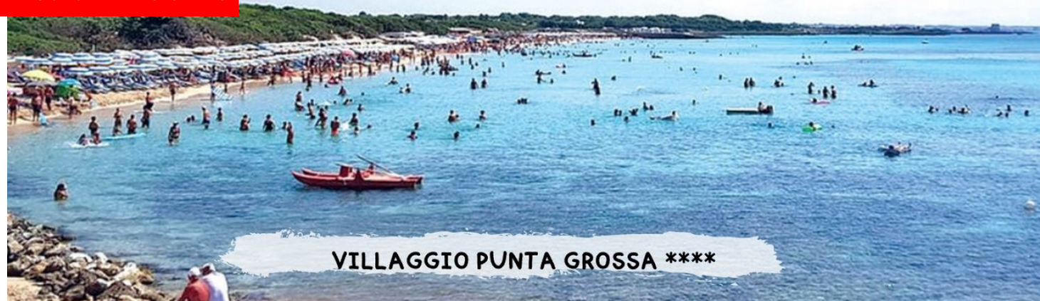
VILLAGGIO PUNTA GROSSA ****