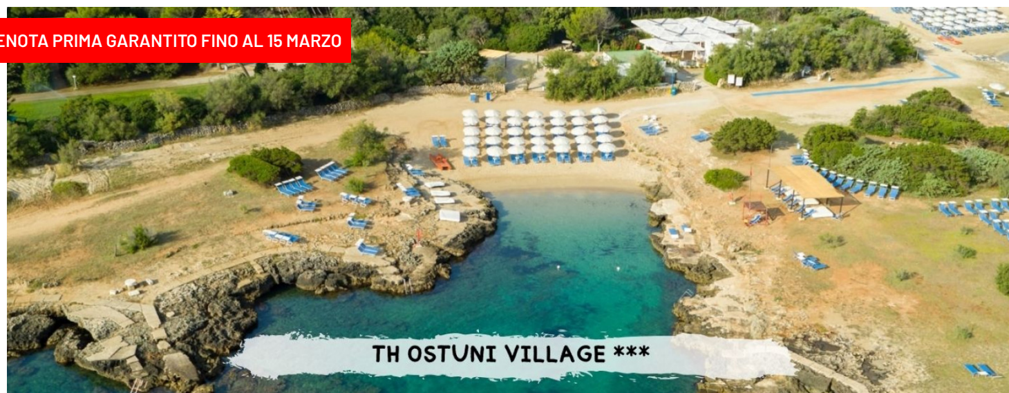
TH OSTUNI VILLAGE ***

PRENOTA PRIMA GARANTITO FINO AL 15 MARZO