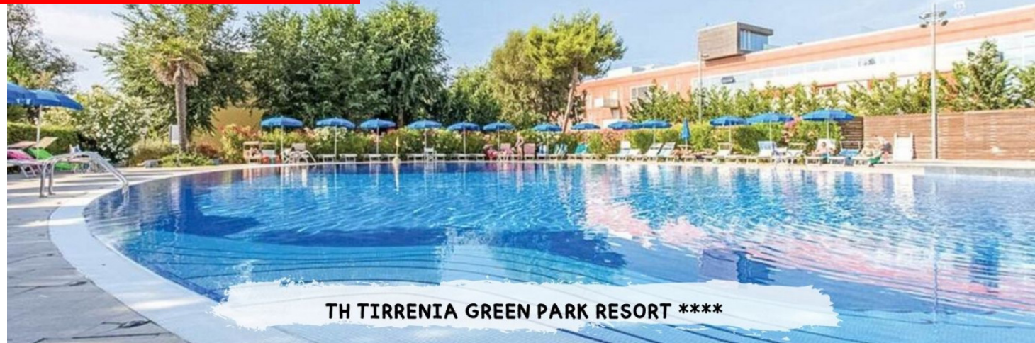
TH TIRRENIA GREEN PARK RESORT ****

PRENOTA PRIMA GARANTITO FINO AL 15 MARZO