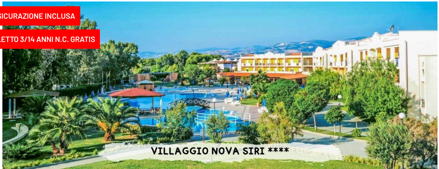
VILLAGGIO NOVA SIRI ****

quote a persona in pensione completa con soft all inclusive